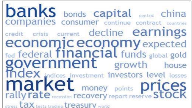
អភិវឌ្ឍន៍ចំណេះដឹងដើម្បីកំណើនសេដ្ឋកិច្ច