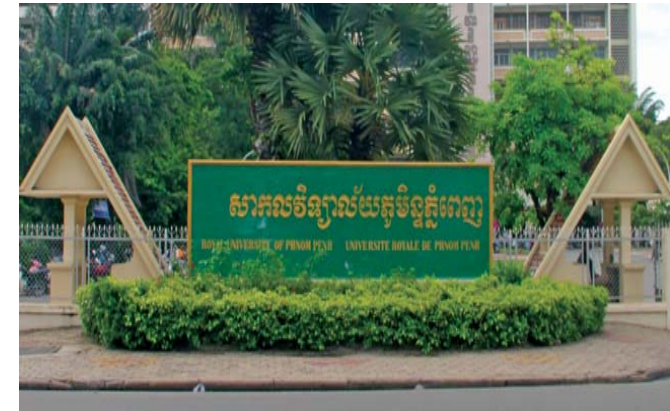
អភិវឌ្ឍន៍អ្នកដើម្បីអភិវឌ្ឍន៍ប្រទេសយើង

ដេប៉ាតឺម៉ង់អភិវឌ្ឍន៍សេដ្ឋកិច្ច ដេប៉ាតឺម៉ង់អភិវឌ្ឍន៍សហគមន៍ ដេប៉ាតឺម៉ង់គ្រប់គ្រងនិងអភិវឌ្ឍន៍ធនធានធម្មជាតិ