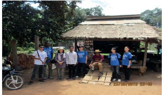
ចងក្រងសហគមន៍ដើម្បីសាមគ្គីភាព