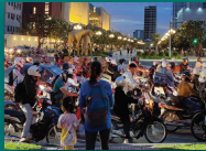
ការកកស្ទះចរាចរណ៍