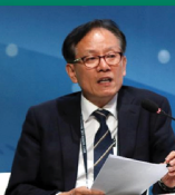
បណ្ឌិត ហ៊ីយ៉ុង ជានី (DR. HYEON PARK) សាស្ត្រាចារ្យបណ្ឌិត និងជាព្រឹទ្ធបុរសសាលាអភិវឌ្ឍន៍ស្រុកស្រីសោយនៃសាកលវិទ្យាល័យសេអ៊ូល(UOS)

សតវត្សទី២១ គឺជាយុគសម័យទីក្រុង ។ យើងសង្កេតឃើញមានការ កើនឡើង នៃចំនួនប្រជាជននៅទីប្រជុំជន និងក្នុងយ៉ាងឆាប់រហ័ស ដែលជាម៉ាស៊ីននៃកំណើន សេដ្ឋកិច្ចប្រទេស។ ក្នុងកាលៈទេសៈអន្តរកាលបែបនេះ យើងត្រូវការចំណេះដឹងសមត្ថភាពក្នុងការរៀបចំផែនការ និងកសាងទីក្រុងប្រកបដោយប្រសិទ្ធផល។ ប្រទេសកម្ពុជា ត្រូវការអ្នកជំនាញដែលមានការបណ្តុះបណ្តាលដែលអាចឆ្លើយតប នឹងបញ្ហាប្រឈមទីក្រុងរួមមានភាពកកស្ទះចរាចរណ៍ ការតាំងទីលំនៅបណ្តោះអាសន្ន បញ្ហាសុខភាព និងអនាម័យ។ នៅក្នុងកិច្ចសហការជាមួយសាកលវិទ្យាល័យភូមិន្ទភ្នំពេញ យើងខ្ញុំមកពីសាកលវិទ្យាល័យសេអ៊ូល(UOS) មានសេចក្តីសោមនស្សក្នុងការចូលរួមដំណើរ លើកកម្ពស់អនាគតអ្នកនាំផែនការសម្រេចទីក្រុងប្រទេសកម្ពុជាឲ្យកាន់តែឆ្លាតវៃ តាមរយៈការអភិវឌ្ឍ និងការរៀបចំផែនការទីក្រុងប្រកបដោយចីរភាព។ យើងជឿជាក់ថាកម្មវិធីសិក្សានេះ នឹងទាំការកសាងអាជីពការងារឱ្យកាន់តែសម្បូរបែប។ ចូរចាប់ផ្តើមដំណើរដំបូងរបស់អ្នកជាមួយពួកយើងហើយស្វែងរកមតិទៅកាន់ ភាពជោគជ័យរបស់អ្នក!