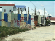
កង្វះទីធ្លាបែតង

សាកលវិទ្យាល័យភូមិន្ទភ្នំពេញ ជាសាកលវិទ្យាល័យឈានមុខគេនៅកម្ពុជា ទាំងការរៀន ការបង្រៀន កាលានុវត្តភាពនៃការសិក្សាស្រាវជ្រាវ និងការចូលរួមក្នុងសកម្មភាពសង្គម។ ក្នុងគោលបំណង ជំរុញទេពកោសល្យក្នុងការអភិវឌ្ឍន៍ក្រុងដោយចីរភាពនៅកម្ពុជា យើងបានបង្កើត ដេប៉ាតឺម៉ង់នៃកម្មវិធីនៃស្រុកស្រីសោយ និងអភិវឌ្ឍន៍ក្រុងដោយចីរភាព នៅសាកលវិទ្យាល័យភូមិន្ទភ្នំពេញ នៅក្នុងឆមាសនេះដោយមាន កិច្ចសហការទាំងចំណេះដឹង និងបទពិសោធន៍ពីភាគីសាធារណៈរដ្ឋបាល។ ដេប៉ាតឺម៉ង់នៃកម្មវិធីនៃស្រុកស្រីសោយ និងអភិវឌ្ឍន៍ក្រុងដោយចីរភាព ទើបតែបង្កើតឡើងនៅក្នុងឆ្នាំ២០២២ ដោយមានការទទួលស្គាល់ពីក្រសួងអប់រំ យុវជន និងកីឡា យោងតាមប្រកាសលេខ ៨៦៨ អយក.ប្រក ចុះថ្ងៃទី១០ ខែកើត ឆ្នាំ២០២២ ដើម្បីផ្តល់ការបណ្តុះបណ្តាលថ្នាក់បរិញ្ញាបត្រសិក្សាអភិវឌ្ឍន៍ ឯកទេសនៃកម្មវិធីនៃស្រុកស្រីសោយ និងអភិវឌ្ឍន៍ក្រុងដោយចីរភាព។