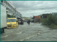
ជំនន់ទីក្រុង